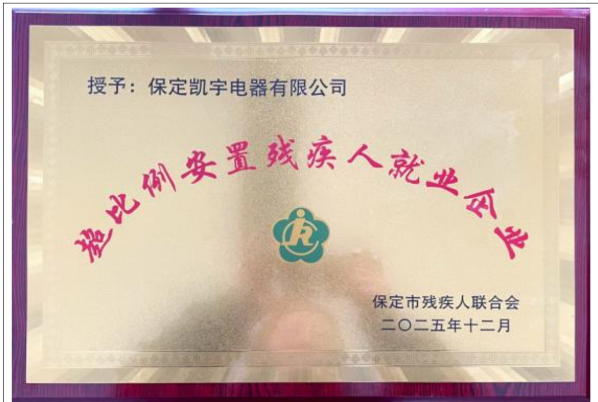
超比例安置残疾人就业企业

公司始终坚守社会责任初心，持续加大残疾人就业吸纳力度，2024 年超比例安置残疾人就业，切实履行社会责任，获得政府表彰。